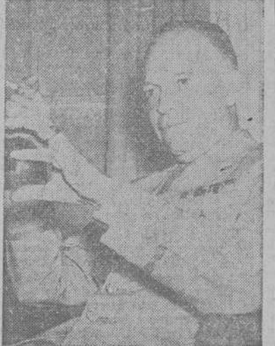
El general norteamericano Dwight D. Eisenhower, jefe de las fuerzas aliadas que operan en el África francesa.

ARGEL, 12.—Oficialmente se anuncia que las tropas norteamericanas han ocupado la ciudad de Bona (departamento de Constantina), según transmite la Agencia Havas-Of. Añade ésta que a las 18:30 horas no había sido alcanzada aún la ciudad de Constantina.—(EFE).