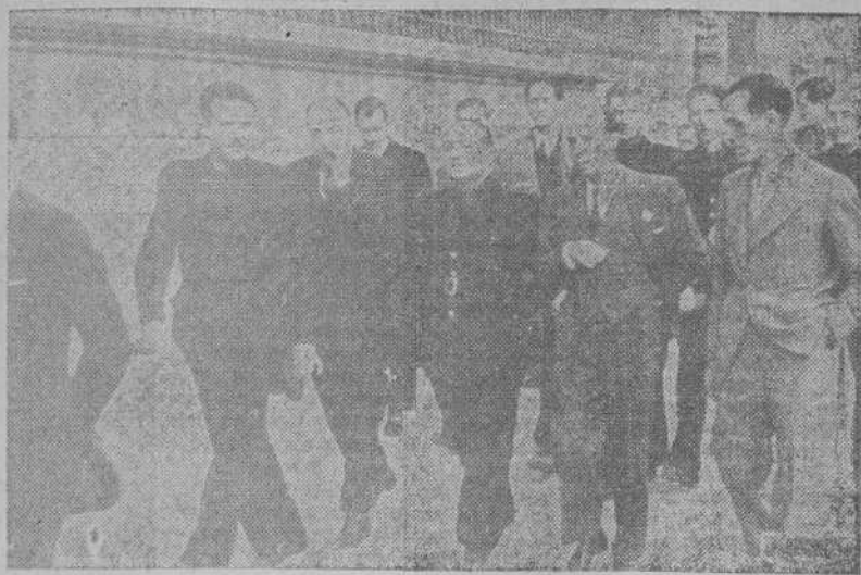
El Delegado Nacional de Prensa, camarada Juan Aparicio, durante su estancia en Reus para asistir a la clausura de la Exposición Bibliográfica y de Prensa provincial celebrada en dicha ciudad (Foto CIFRA).