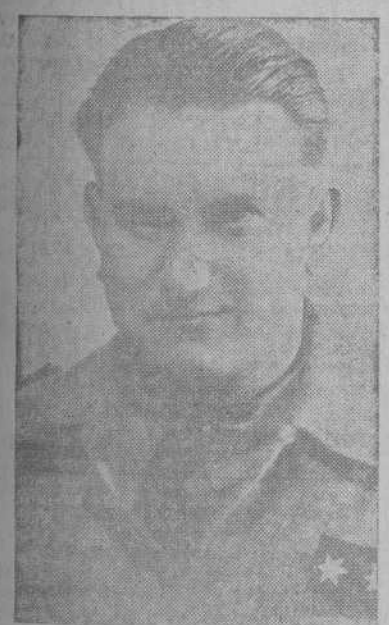
Don Fernando Maria Castiella nombrado Delegado nacional del Servicio Exterior

¡ESPAÑOLES! ES PRECISO E IMPRESCINDIBLE QUE A LA VISTA DE LAS RUINAS DEL CERRO DE LOS ANGELES, NO PUEDAN REIRSE LOS LOBOS QUE ESTAN EN LA PENUMBRA, DICIENDO: ¡MIRA QUE CASO HACEN DE JESUS!