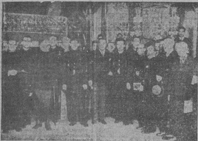
Autoridades, jerarquías del Movimiento y representaciones, en el acto inaugural de la I Exposición de Arte organizada por Educación y Descanso, en el salón de la Reunión de Artesanos, de La Coruña

Ha sido inaugurada con asistencia de autoridades y jerarquías