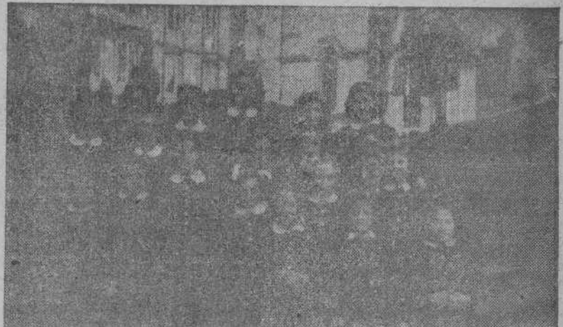
El coro integrado por acogidas en el Hospicio Provincial que ganó el primer premio en el concurso de villancicos, organizado por el Frente de Juventudes de la Sección Femenina

rias bases navales y un importante aeródromo germano-italiano, en el que contempló la salida de una escuadrilla de aviones de transporte que, cargados de material de guerra, se dirigían a África.