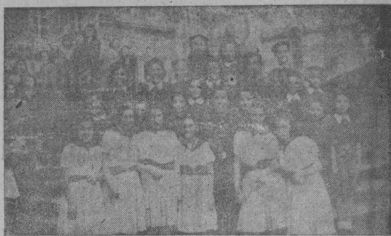
El coro de Flechas, del Frente de Juventudes de la Sección Femenina, que obtuvo el segundo premio