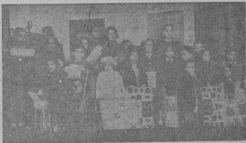
Grupo de niños que asistieron a la función infantil de Reyes Magos, organizada por la Asociación de la Prensa de La Coruña

Hubo reparto de magníficos juguetes, función teatral y espléndida merienda