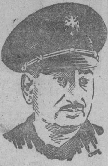
JOSE LUIS DE ARRESE Ministro Secretario del Partido

En el límite de la provincia lo recibieron el Gobernador Civil y el Jefe Provincial