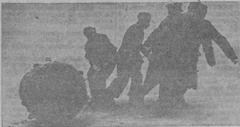
Una mina inglesa arrojada a tierra en la costa de Flandes. Después de haber desarmado la espoleta, los soldados alemanes la arrastran para proceder a su destrucción.