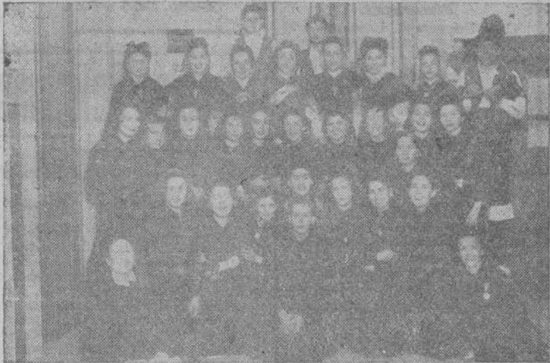
El Coro de El Ferrol del Caudillo y el de Santiago, que tomaron parte en el concurso de danzas y coros regionales celebrado ayer en La Coruña