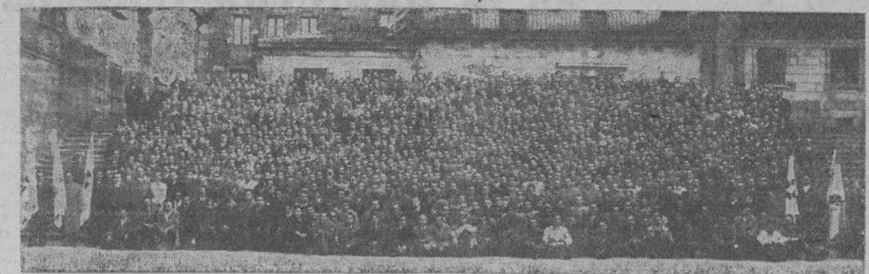
SANTIAGO. — Los estudiantes universitarios al finalizar los Ejercicios Espirituales celebrados recientemente

SANTIAGO 5.—El Rector de esta Universidad ha sugerido a los Rectores del resto de España la idea de celebrar una gran peregrinación de alumnos de todas las Universidades españolas a Santiago para ganar el jubileo del Año Santo.