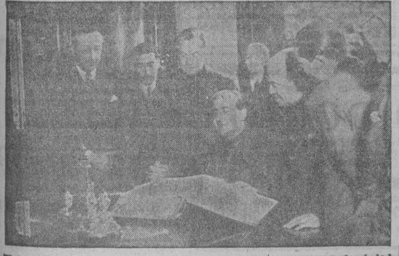
El Delegado Nacional de Prensa firmando en el Libro de Oro de la ciudad durante su visita al Palacio Municipal