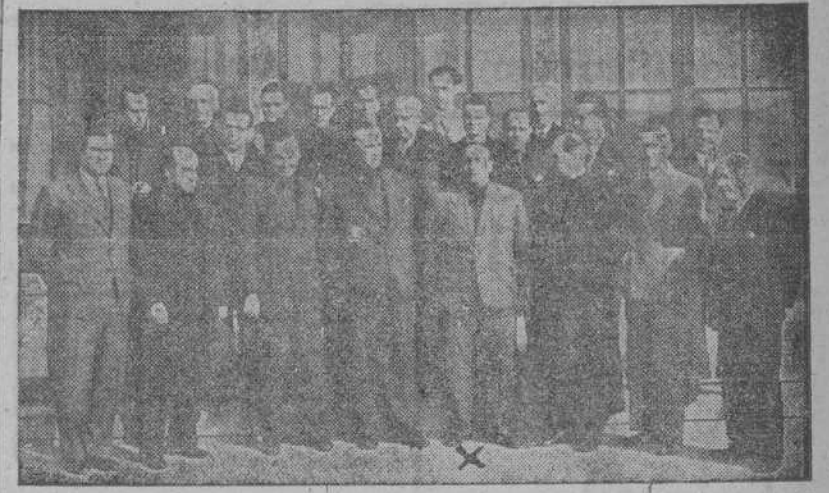
El Delegado Nacional de Prensa, con el Gobernador civil, el Secretario provincial de Falange, el Alcalde accidental, la Directiva de la Asociación de La Coruña y otros periodistas después del agasajo que fué ofrecido al camarada Aparicio

(CONTINUACION DE PRIMERA) nimiento en varias obras curiosas que allí se guardan, acerca de las que se le facilitaron detalles. Salíó altamente complacido de dichas visitas.