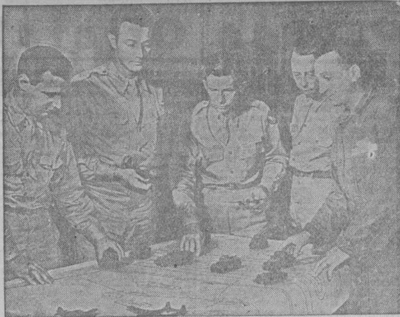
Cadetes de aviación estudiando un problema de combate terrestre. Antes de hacer vuelos de entrenamiento, los alumnos han de saber reconocer en el aire los aparatos amigos y enemigos