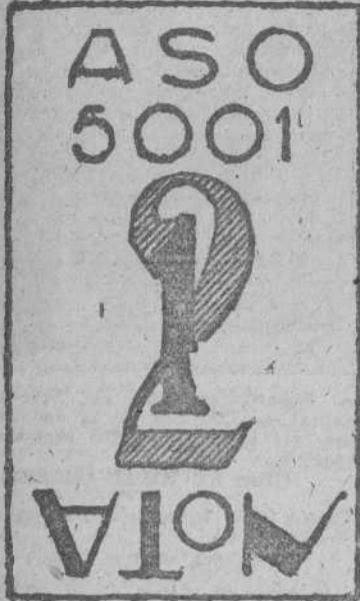
Título de película

Canadá produce los dos tercios del mundo