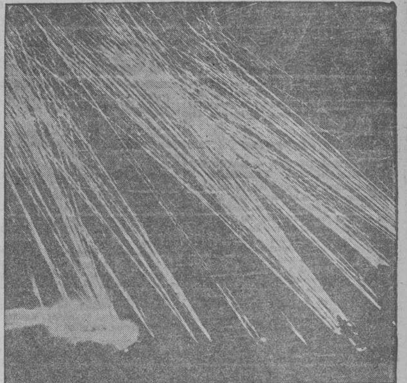
Baterías de cañones antiaéreos, en pleno Océano, durante un ataque de los aviones del Eje contra una base aliada en el Africa septentrional