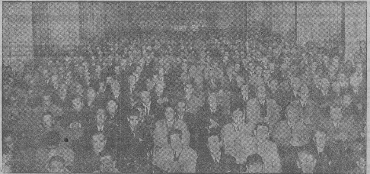
Aspecto de la iglesia del Sagrado Corazón de Jesús de La Coruña, durante una de las jornadas de Ejercicios Espirituales para hombres. El templo está diariamente abarrotado de fieles ejercitantes que escuchan con el mayor recogimiento las sagradas lecciones dadas por el P. Lamamié de Cléraco S. J.