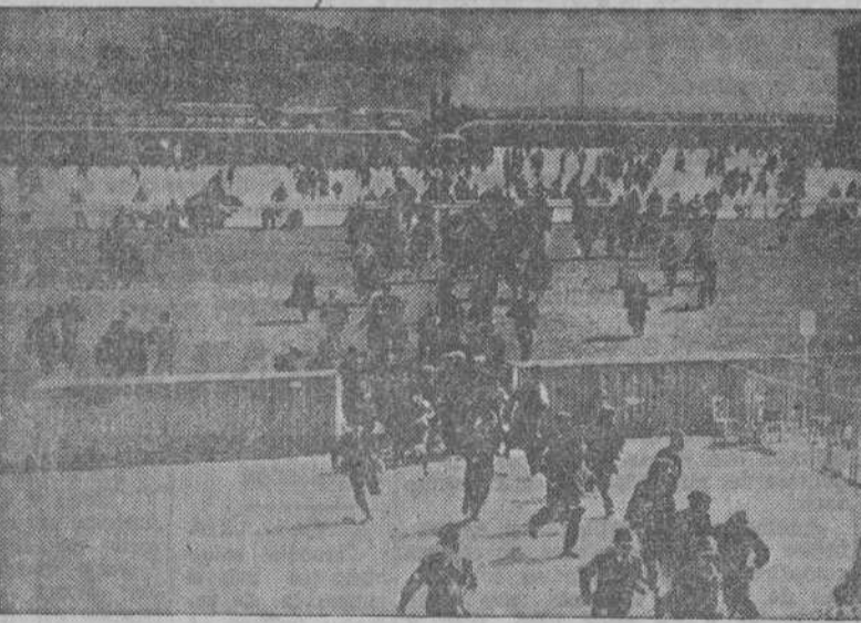
He aquí una impresionante fotografía tomada durante el bombardeo de la R. A. F. sobre el Hipódromo de Longchamps. El público huye despavorido en busca de un refugio