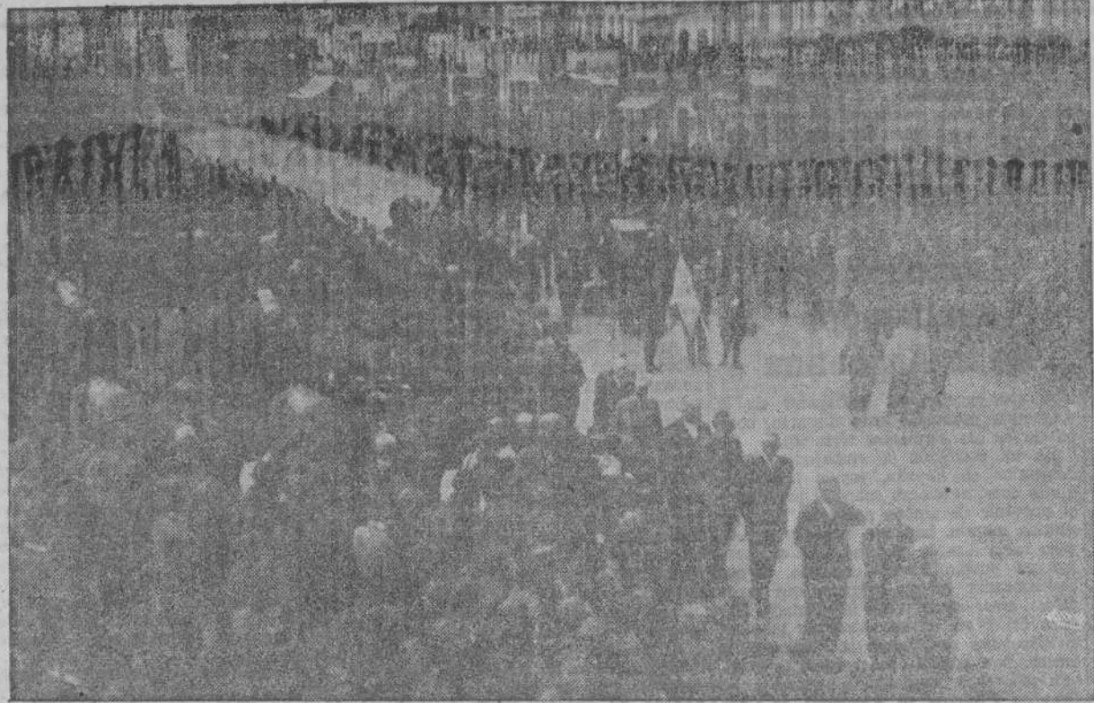
La solemne procesión de la Dolorosa a su paso por la Avenida de los Cantones. El pueblo coruñés renueva todos los años su devoción predilecta a la Virgen de los Dolores

Como final de la solemne novena que en honor de la Santísima Virgen de los Dolores se vino celebrando en San Nicolás con asistencia de numerosos fieles que todos los días llenaban el sagrado recinto, hubo ayer por la mañana varias misas de comunión en las que se acercaron a la Sagrada Mesa millares de coruñeses.