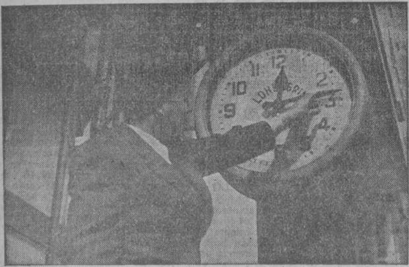
Hoy, sábado, a las once de la noche, deberán ser adelantados los relojes una hora, en cumplimiento de una disposición oficial