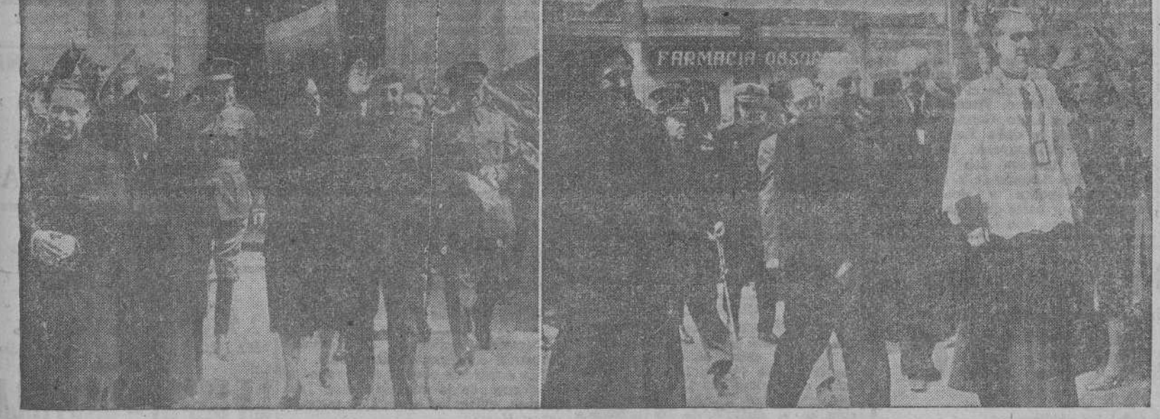
El Caudillo, acompañado de su esposa y de las personalidades de su séquito, visitó la Iglesia de San Nicolás para orar ante la imagen de la Virgen de los Dolores, devoción predilecta del pueblo coruñés. En las fotografías, Su Excelencia a la llegada y a la salida del templo