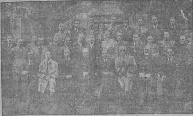
Alumnos de Derecho que terminaron la carrera por enseñanza libre, en Santiago con algunos catedráticos

EL IDEAL GALLEGO Se vende en MADRID en la Biblioteca del Metro (Puerta del Sol)