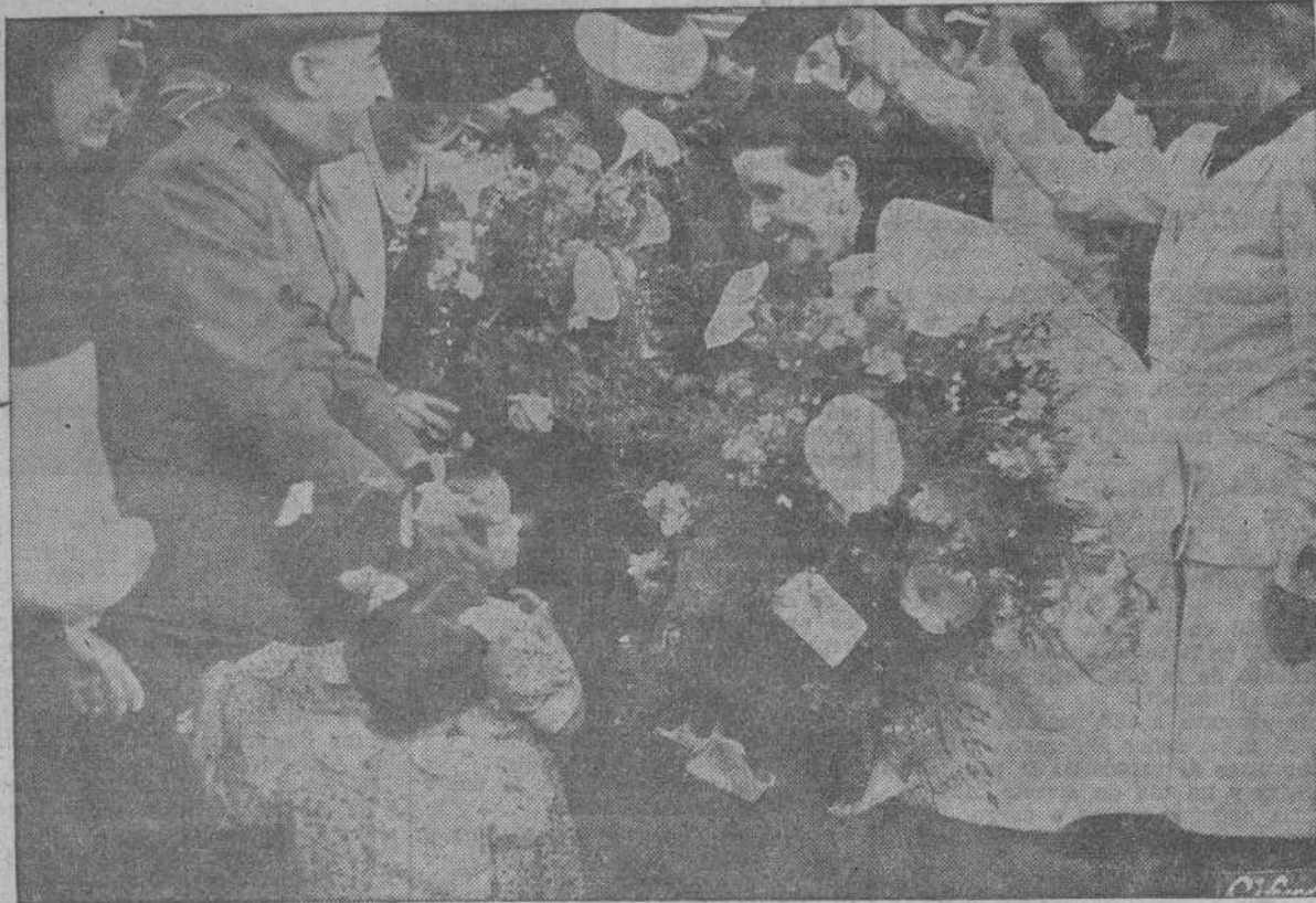
El Caudillo, acompañado de su esposa, visitó el Hogar "José Antonio" de Auxilio Social y acaricia a las niñas allí acogidas