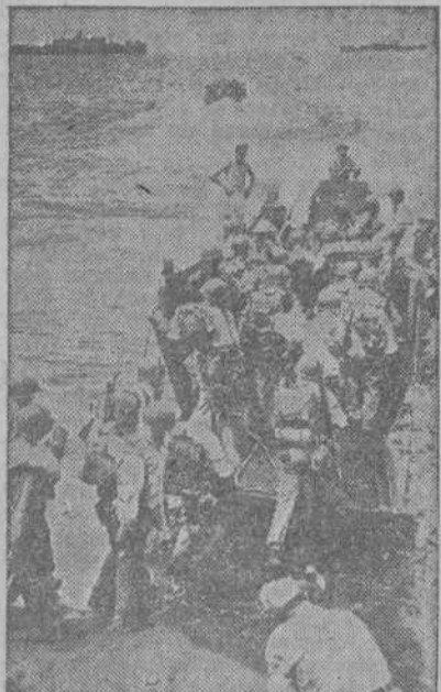
Soldados de Infantería de Marina subiendo a las barcas que los transportarán a los barcos surtos en aguas de Guadalcanal, después de haber sido relevados por el Ejército

Preguntado el alcalde soviético cómo conocía estos detalles, me contestó que se había necesitado gente para cubrir las fosas, ya que los agentes de la G. P. U. no quisieron encargarse de ello, y por esta circunstancia habían sido reclutados hombres en los alrededores. Una vez tapadas las fosas, se les prohibió regresar a sus hogares y fueron trasladados, con un pretexto cualquiera, a los sitios más diversos. Como alcalde del pueblo—añadió—se me concedió el derecho excepcional de regresar a mi casa; pero bajo pena de muerte, se me prohibió contar lo que había visto.—(EFE).