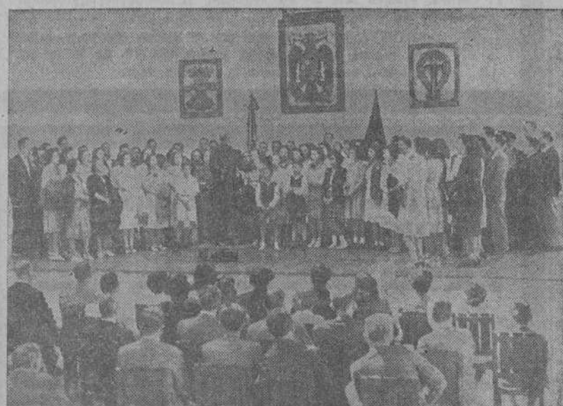
La Coral de Educación y Descanso de Valladolid, durante su audición en la Fábrica de Tabacos de La Coruña.

En los Balcanes existe una concentración de más de cincuenta divisiones—sobre todo en la región de Bulgaria y Rumania—y con ellas parece que se encuentra el general Rommel según se ha conjeturado por diversos orígenes. Se trata de una región eminentemente estratégica donde pueden actuar bien hacia Rusia Meridional o bien hacia Grecia y Mediterráneo oriental según el curso que tomen los acontecimientos.