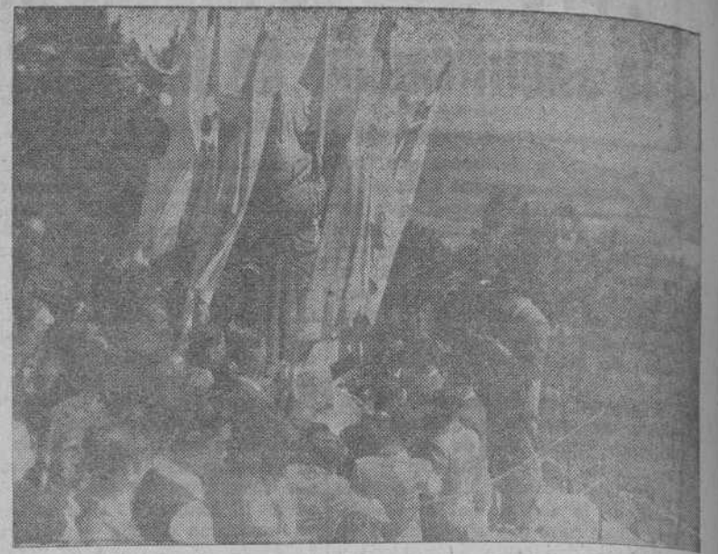
Ante la imagen de la Virgen de Pastoriza, los jóvenes de Acción Católica de La Coruña renovaron el juramento de defender el dogma de la Inmaculada