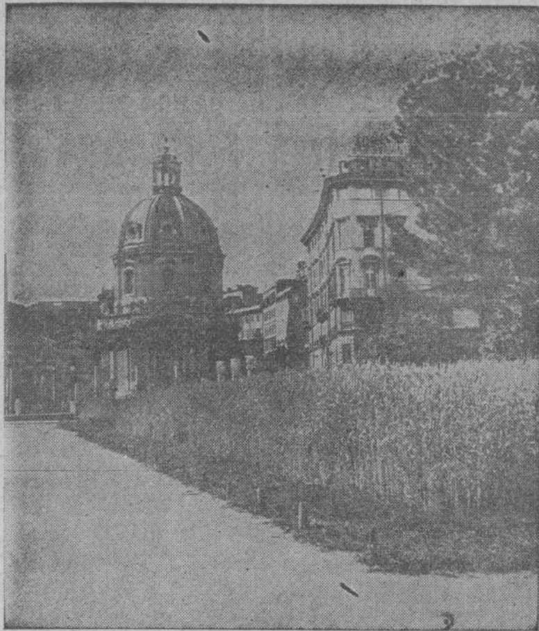
ROMA.—En la Villa del Imperio florece el trigo sembrado en los jardines para subvenir a las necesidades de la guerra.