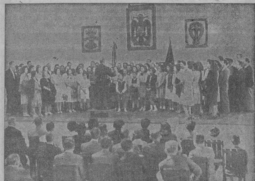
La Coral de Educación y Descanso de Valladolid, durante su audición en la Fábrica de Tabacos de La Coruña.

firmado por diversos orígenes. Se trata de una región eminentemente estratégica donde pueden actuar bien hacia Rusia Meridional o bien hacia Grecia y Mediterráneo oriental según el caso que tomen los acontecimientos.