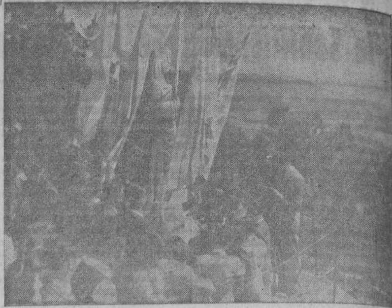
Ante la imagen de la Virgen de Pastoriza, los jóvenes de Acción Católica de La Coruña renovaron el juramento de defender el dogma de la Inmaculada.