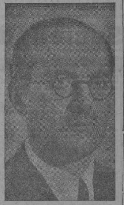
Excmo. Sr. D. José Ibáñez Martín, Ministro de Educación Nacional