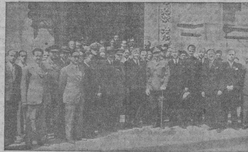
Autoridades militares, civiles y representaciones, a la salida de la función religiosa celebrada en la Iglesia del Sagrado Corazón de Jesús por las clases sanitarias de La Coruña, con motivo de la festividad de su Patrona, Nuestra Señora del Perpetuo Socorro

La Vocalía de Juegos y Deportes del Consejo Territorial de los Jóvenes de Acción Católica, organiza un campeonato de Ajedrez, para las secciones de Jóvenes y Aspirantes. A fin de perfeccionar el cuadro de participantes, ha quedado abierto en el Secretariado correspondientes de este Consejo, Riego de Agua, 16, entresuelo, el registro de inscripciones. Finaliza el plazo mañana miércoles, a las 9 de la tarde.