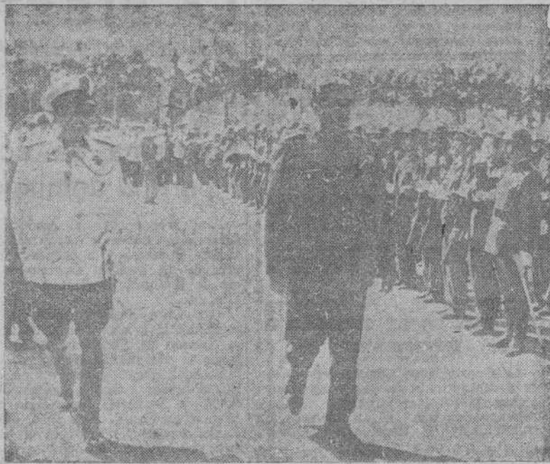
El ministro de Trabajo, camarada Girón, con el general Moscardó, revistó las tropas que le rindieron honores a su llegada a Manresa, donde presidió una brillantísima concentración de ex-combatientes.