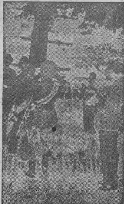
El general señor Cayuela, gobernador militar de la Plaza, imponiendo la Medalla Militar a una de las banderas

destrucciones. Le afectó especialmente la noticia de que varias bombas habían alcanzado y destruido la Basílica de San Lorenzo. Entonces decidió ir a visitar los lugares afectados por el bombardeo, y a las seis de la tarde salió del Vaticano, sin avisar a nadie. Mientras observaba los daños fué advertida su presencia por las gentes que le hicieron objeto de impresionantes manifestaciones de afecto, respeto y adhesión. El Pontífice, descubierta permaneció algunos instantes ante las ruinas de la basílica. Finalmente, dió la bendición apostólica a la muchedumbre arrodillada en la plaza.—(EFE).