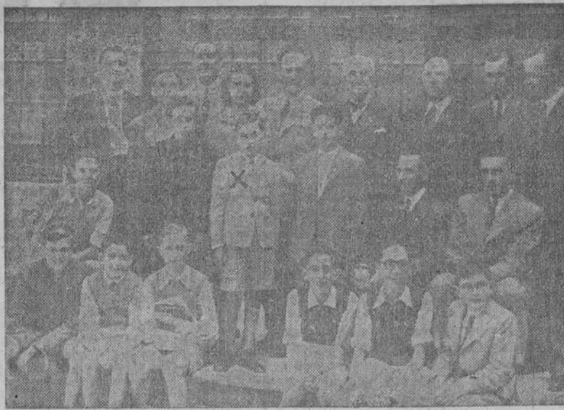
Arturito Pomar, el precoz ajedrecista, rodeado de jugadores coruñeses que contendrán con él.