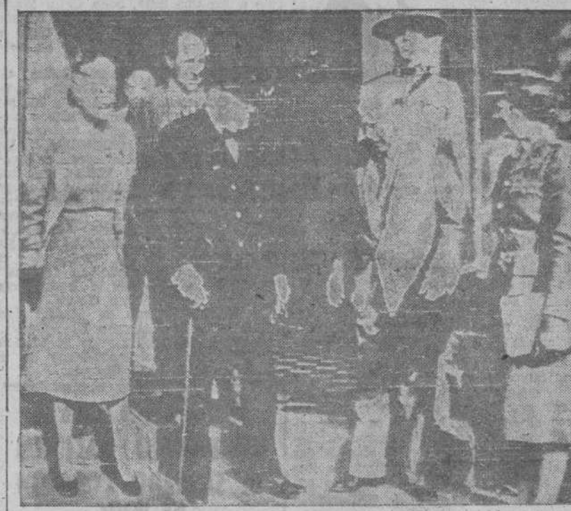
El Primer Ministro canadiense Mackenzie King (segundo de la derecha) recibiendo a Churchill y a su esposa e hija, a su llegada a Quebec. (Foto recibida por radio)