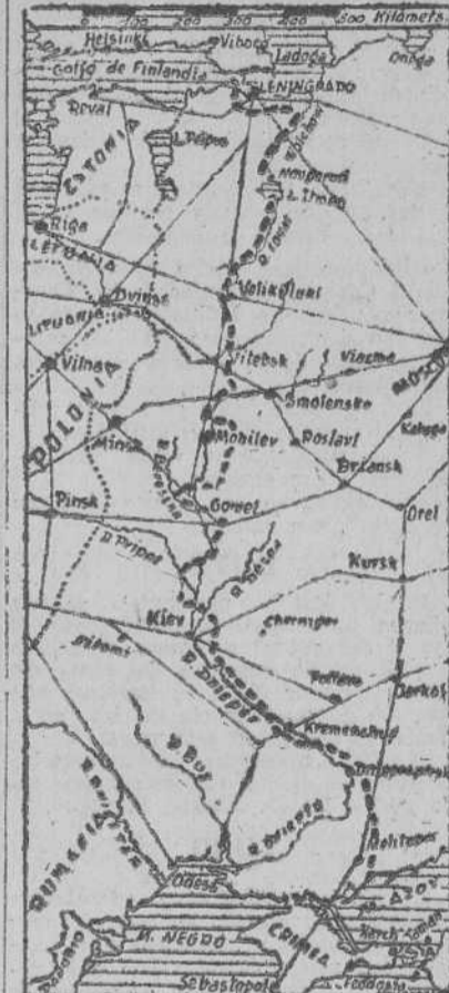
El curso alto de los ríos Dnieper y Dvina—entre Smolensko y Vitebsk—tratando de penetrar hacia occidente. Y en el sector de los lagos Ilmen y Ladoga—zona del cerco de Leningrado—cierta actividad comienza a manifestarse.

Esta es, a grandes rasgos, la situación del frente oriental en el momento de comenzar la "rasputitsa" o estación de los caminos intrasitables por el fango.