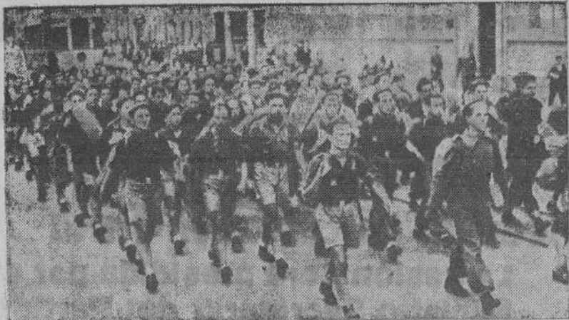
Camaradas del Frente de Juventudes, de diversos pueblos de la provincia, a su regreso después de haber asistido a la concentración celebrada en Madrid el "Día del Caudillo".