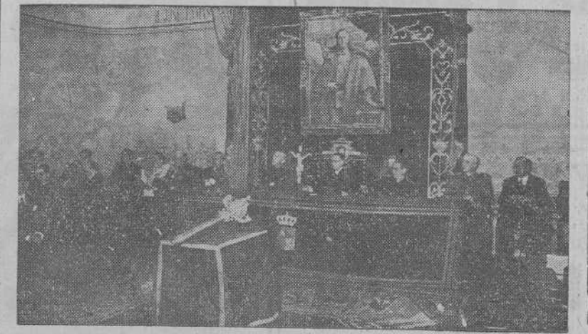
SANTIAGO.—Presidencia del acto solemne celebrado con motivo de la apertura del Curso en la Universidad.

fensiva de la cabeza de puente del Kuban y en los sectores meridional y central del frente se han distinguido muy especialmente la novena división austriaca de "Panzer" y las divisiones 306 de Westfalia y 307 de Baviera.