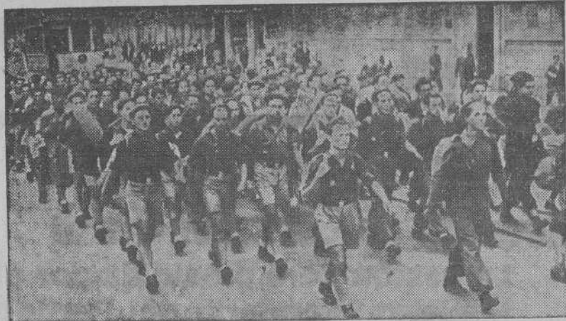
Camaradas del Frente de Juventudes, de diversos pueblos de la provincia, a su regreso después de haber asistido a la concentración celebrada en Madrid el "Día del Caudillo".

Aprobada la Ley Universitaria e iniciado el curso se dispone a cumplir la alta misión que le ha sido asignada: encuadrar a todos los estudiantes bajo la bandera del cisne complutense para que constituyan una sola familia, infundir en ellos el espíritu de la Falange, participar en la selección de escolares a los efectos de adjudicar pensiones o becas, informar a los estudiantes sobre los problemas de la enseñanza a través de un centro de orientación y trámite y, en fin, encauzar los anhelos de los escolares hacia el porvenir de grandeza que anhelan para España. El S. E. U. que ha escrito páginas magníficas en la historia española de los últimos años sabrá cumplir su misión con un alto espíritu de hermandad y disciplina y con el ánimo dispuesto al servicio de Dios y de la Patria.