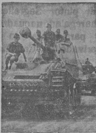
Fuerzas blindadas alemanas en uno de los sectores bélicos de la costa italiana.