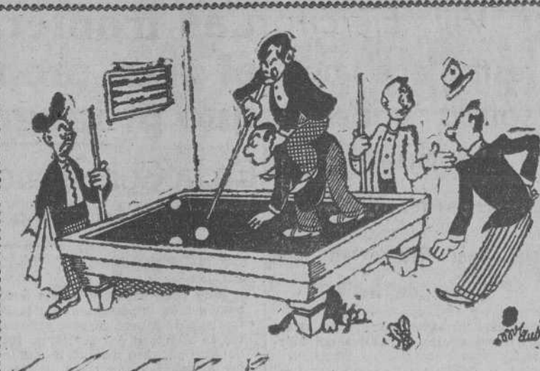
EN LOS BILLARES