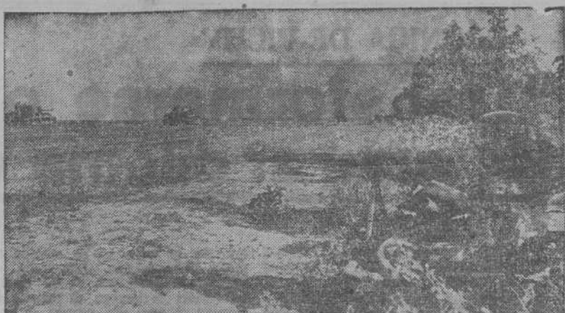
Protegiendo el avance de la Infantería alemana, los tanques "Tigres" van delante para abrir paso y "limpiar" el terreno de posibles enemigos.