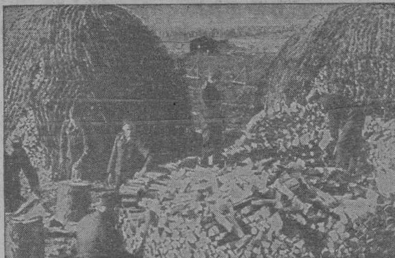
Estos soldados de una batería antiaérea alemana del mar Glacial, preparan la leña que les preservará del frío durante todo el invierno. ¡Cómo si no hubiese ya bastante "leña"!