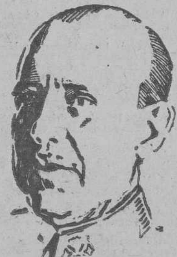
CONDE DE JORDANA

—España no tiene necesidad alguna de definir una actitud que está ya adoptada con toda claridad y transparencia, de "Neutralidad" ajustada a las normas del Derecho Internacional, establecidas con unánime asentimiento de todos los países con anterioridad a la guerra. Las obligaciones de esta neutralidad las cumple España con sincera y auténtica buena fe, poniendo en ello todos los recursos de un Estado fuerte, dueño enteramente de la situación, cuyos órganos de mando actúan en plenitud de su funcionamiento. Aquellos sucesos y hechos que dentro de una situación de orden pueden efectuarse constituyen un mal que brota en todos los países, incluso en los beligerantes, y el daño que ocasionan a España en su soberanía y en sus relaciones amistosas con otros países permite calificar a sus autores, sean quienes fueren, entre sus enemigos.