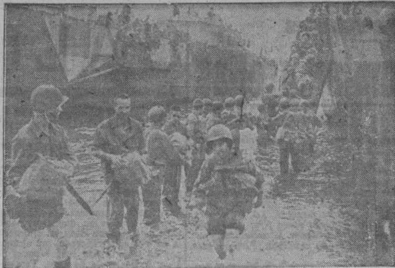
Con los zapatos colgados al cuello, una enfermera del Ejército americano vadea el trecho de mar que la separa de la costa italiana.