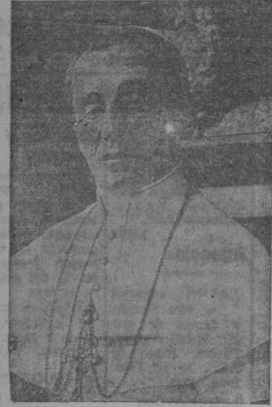
S. SANTIDAD BENEDICTO XV