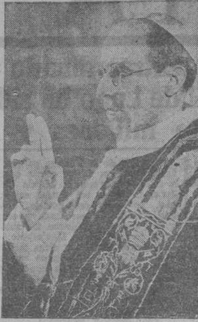
EL PAPA REINANTE PÍO XII