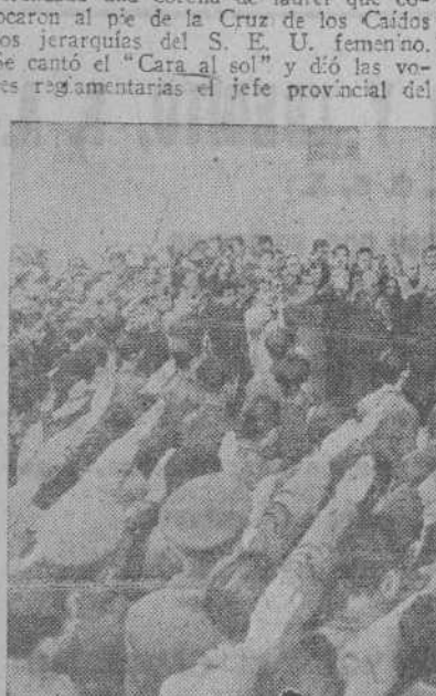
Jerarquías del Movimiento, y del S. E. U.; directores y profesores de los Centros docentes, Falanges Juveniles de Franco, y público, a la salida de la misa que se dijo en la iglesia de los Padres Dominicos...