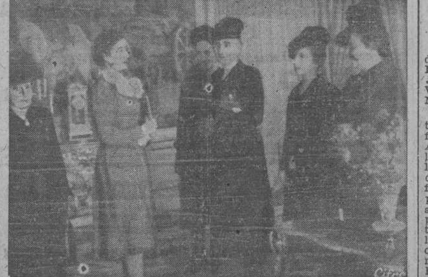
MADRID.—Doña Carmen Polo de Franco recibe a las señoras del Patronato de Protección a la Mujer, del que es Presidenta honoraria