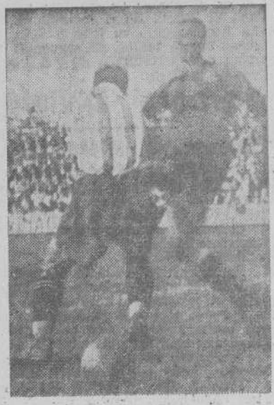
Partido Deportivo-Murcia — Una muestra del noble juego practicado por el equipo forastero