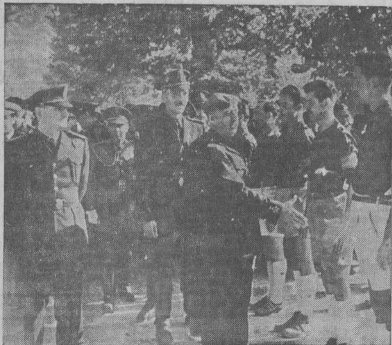
S. E. el Jefe del Estado, Generalísimo Franco, acompañado del Ministro Secretario y del Delegado nacional del Frente de Juventudes, visita el Campamento Nacional establecido para a concentración celebrada con motivo del Día del Caudillo.