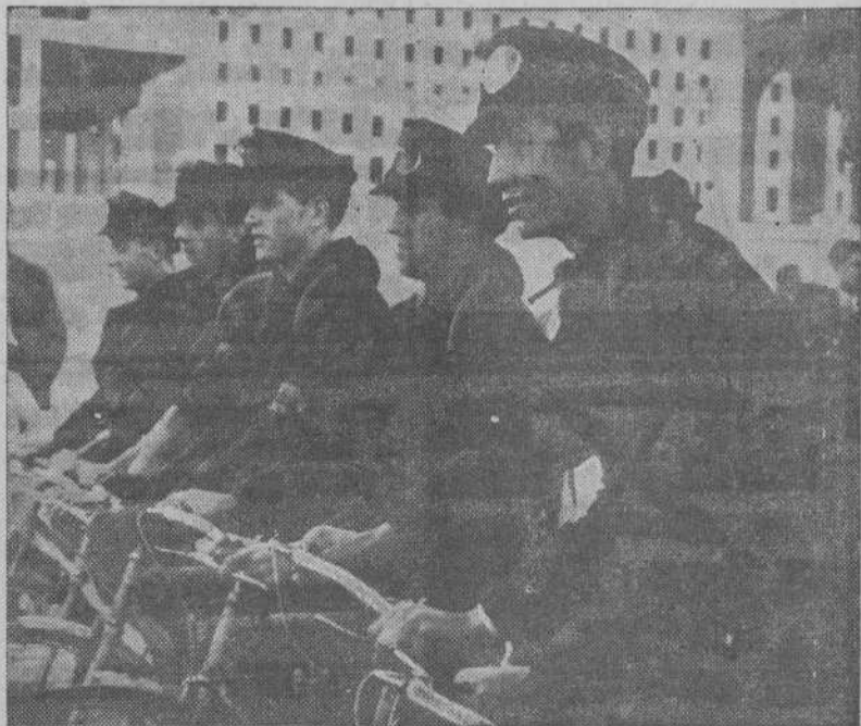
MADRID.—Los ciclistas del Frente de Juventudes que, llegados de todas las provincias de España, han formado parte en la concentración de las Falanges Juveniles de Franco

"No explotéis la victoria en un sentido no cristiano"