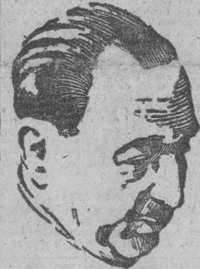
Excmo. Sr. D. José Félix de Lequerica, Ministro de Asuntos Exteriores

El delegado nacional de Sindicatos, acompañado de todas las autoridades y jerarquías, marchó a Puebla de Val-