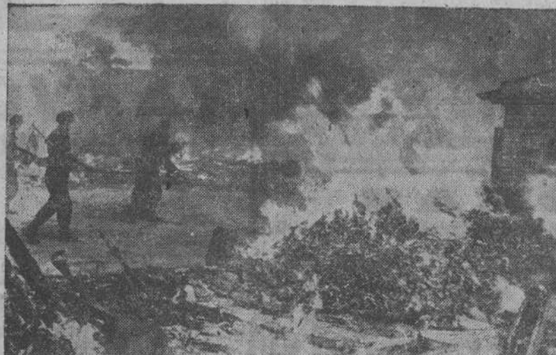
Granaderos tanquistas alemanes se abren paso entre el fuego de una aldea incendiada por los soviets

En pocas naciones la palabra "normalidad" tiene tan exacto sentido como en España