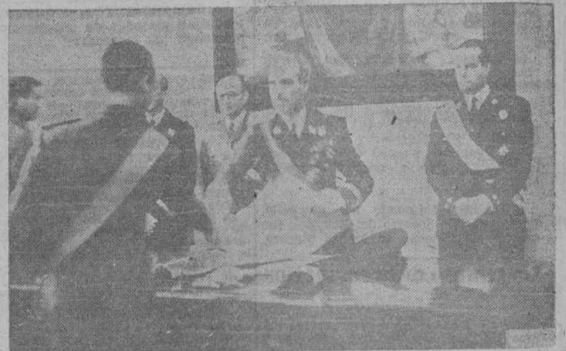
MADRID.—El ministro del Ejército, con los de Gobernación y Aire, y el Secretario General del Ministerio de Marina, en representación del Ministerio del Departamento, presidió la entrega de fajines y despachos a los jefes y oficiales de la 41 promoción de la Escuela de Estado Mayor

ENTREGA DE DESPACHOS A JEFES Y OFICIALES DE ESTADO MAYOR