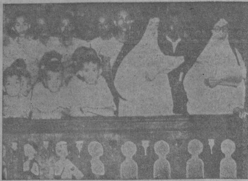
Monjas, escolares y población civil en la reapertura oficial del Colegio del Santo Niño en San José, localidad de la isla de Leyte, donde acaban de finalizar las operaciones militares