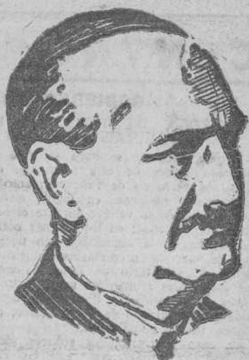
Excmo. Sr. D. Alfonso Peña Boeuf, Ministro de Obras Públicas

—Lo primero que a mi juicio debe destacarse con motivo de esta inauguración—comienza diciéndome el señor Peña—es que toda la instalación, equipos eléctricos, subestaciones y máquinas eléctri-