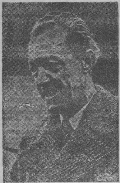
El conde Nicola Carandini, embajador italiano en Londres, que recientemente se ha posesionado de su cargo.