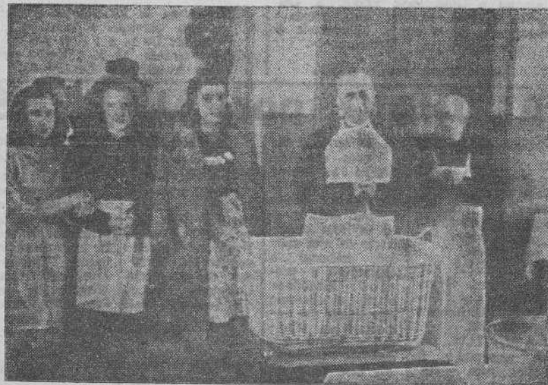
MADRID.—La señorita Carmen Polo de Franco, hija de S. E. el Jefe del Estado, ha festejado su presentación en sociedad sirviendo personalmente la comida a 800 ancianos desamparados en el comedor de Almagro.