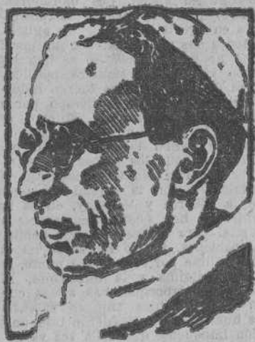
Roma, podemos recibir aquí a nuestros venerables hermanos y tratar con ellos de aquellas necesidades jamás conocidas has-

Cuanto más se prolonga la guerra, tanto más se agravan las múltiples dificultades que han impedido, por desgracia, proveer, conforme a las mejores tradiciones del pasado y a las esperanzas de los pueblos que forman la universalidad de la Iglesia, a no pocos puestos vacantes. Ha sido completamente imposible para muchos la venida de los Obispos a la Ciudad Eterna con objeto de venerar el sepulcro de San Pedro y visitar al que es, aunque indigno, sucesor suyo y pedir al Todopoderoso la unión de todos los miembros de la Iglesia con su cabeza visible. Nos esperamos con ansia el día en que, abiertos todos los caminos de