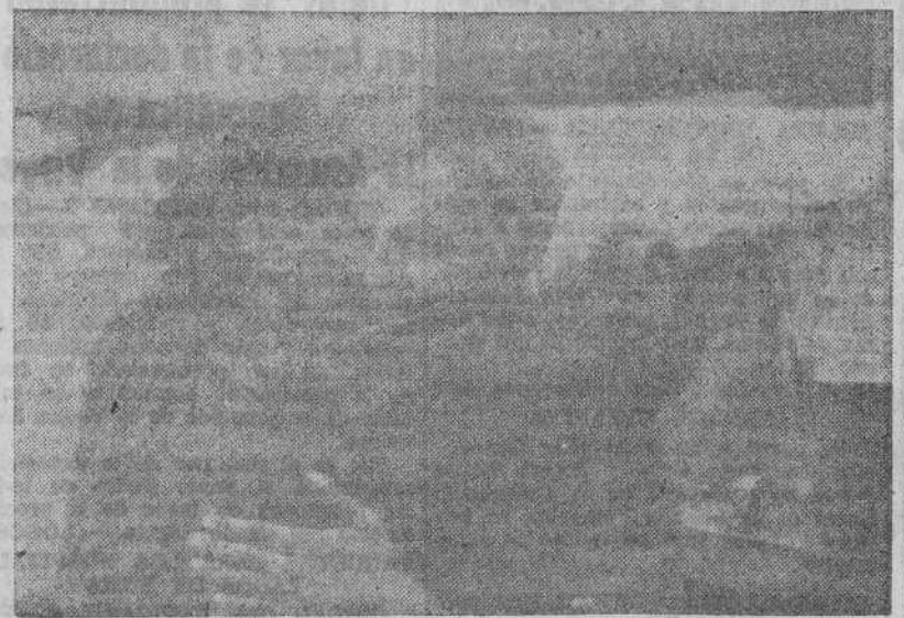
Un obrero húngaro abraza emocionado al primer granadero tranquilo alemán que entró en una ciudad del Este de Hungría, exteriorizando así su contento por haber dejado de sufrir bajo el terror soviético.