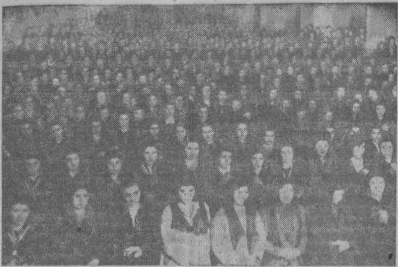
Aspecto que ofrece la iglesia del Sagrado Corazón durante los ejercicios espirituales para sirvientas...