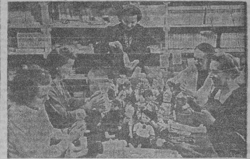
Un grupo de mujeres de una fábrica alemana aprovecha sus ratos de descanso confeccionando muñecos que proporcionarán una alegría a los hijos de sus camaradas