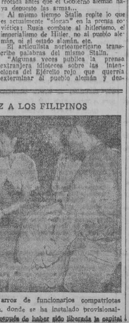
Peisanos filipinos reciben raciones de arroz de funcionarios compatriotas suyos, en un cinematógrafo de Manila, donde se ha instalado provisionalmente ese servicio, inmediatamente después de haber sido liberada la capital.