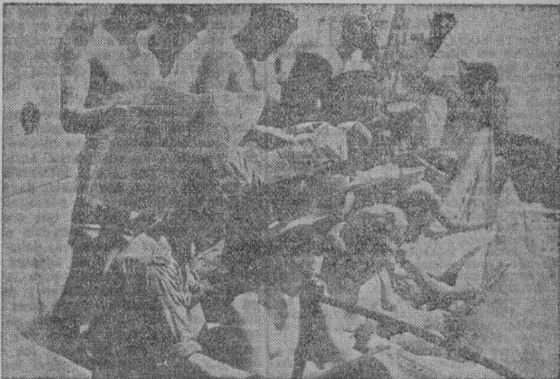
Un servicio especial aéreo permite la entrega de periódicos dominicales a los marinos ingleses que prestan servicio con la flota del Pacífico. He aquí a la tripulación de un submarino británico leyendo unos periódicos londinenses, solamente con cuatro días de retraso.