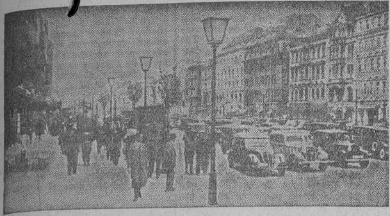
La famosa vía berlinesa Unter den Linden, en su esquina con la Friedrichstrasse, en los días de paz

Un telegrama familiar me llamó a Hamburgo a fines de febrero de 1895. Al día siguiente, sin embelecado de pasaporte y con tal cual monedita de oro español en el bolsillo, salí en el sud-expreso para París, empalmé allí con el expreso de Colonia y, casi de un tirón, cincuenta horas después de haber dejado Madrid, estaba en la gran urbe del Elba. Terminé mi quehacer y se impuso el regreso. Pero no quise venirme de Alemania sin ver Berlín, aunque fuese en una ojeada que todavía no podía llamarse cinematográfica. Unos marcos más y, en el rápido Hamburgo-Berlin, entonces el de mayor celeridad del continente, en tres horas, y con sólo una parada en Wittenberg, llegué a la rutilante capital del gran imperio. En el patio de la estación, un policía me dió una ficha con el número del alquilón que me correspondía tomar; no podía ser otro; el ordenamiento alemán se apoderaba de mí para interpretar mi voluntad. Minutos después estaba en el Hotel Bristol, Unter den Linden, y creo que al de más postín de la ciudad.