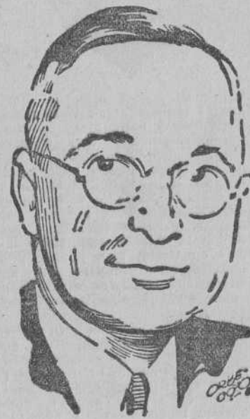
HARRY S. TRUMAN

"Como Presidente de los Estados Unidos, declaro que los Ejércitos aliados, mediante su sacrificio, amor al deber y con la ayuda de Dios, han obligado a Alemania a aceptar la rendición incondicional. El mundo del Oeste ha sido liberado de las fuerzas del mal, que durante más de cinco años ahorraron los cuerpos de sus habitantes y arruinaron las vidas de millones y millones de hombres libres. Violaron sus iglesias, destruyeron sus hogares, corrompieron a sus hijos y asesinaron a sus seres amados. Nuestros Ejércitos han devuelto la libertad a estos pueblos que tanto sufrían,