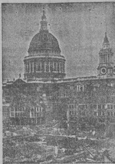
Edificios contiguos a la Catedral de San Pablo, de Londres, destruidos por las bombas alemanas. En la Catedral de San Pablo se celebrarán estos días solemnes ceremonias religiosas conmemorativas de la Victoria.