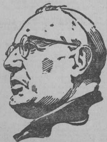
do ánimo y buena voluntad los medios pacíficos de solucionar los con-

La guerra sólo es justa cuando es necesaria, pues es tan grande el cúmulo de males que engendra y en proporciones tan aterradoras la guerra moderna con el utillaje de formidable maquinaria de destrucción, que