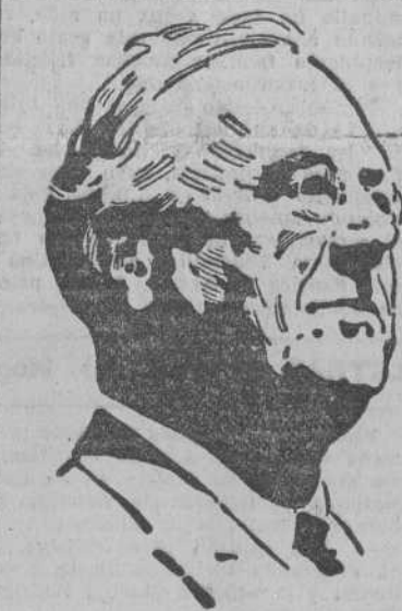
ROOSEVELT el fallecido Presidente de los Estados Unidos que ha contribuido en forma decisiva a forjar la victoria aliada en los frentes europeos

En las principales capitales europeas y americanas han dado comienzo las fiestas de la Victoria.