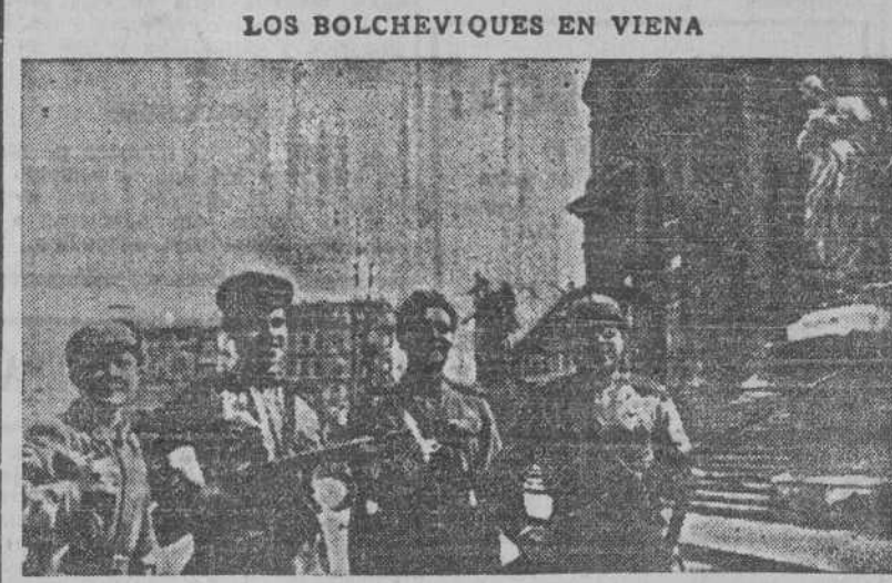
Esta es una de las primeras fotografías llegadas a Londres sobre la ocupación de Viena por las tropas comunistas y reproducida por la Prensa británica (Foto CIFRA).

Han comenzado las fiestas de la Victoria en las capitales europeas y americanas