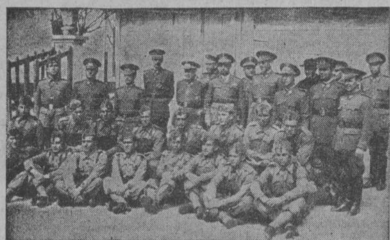
Grupo de soldados pertenecientes al Batallón de Transmisiones que has sido premiados por su comportamiento y aplicación durante el año. El general Durán Salgado hizo entrega de las recompensas.