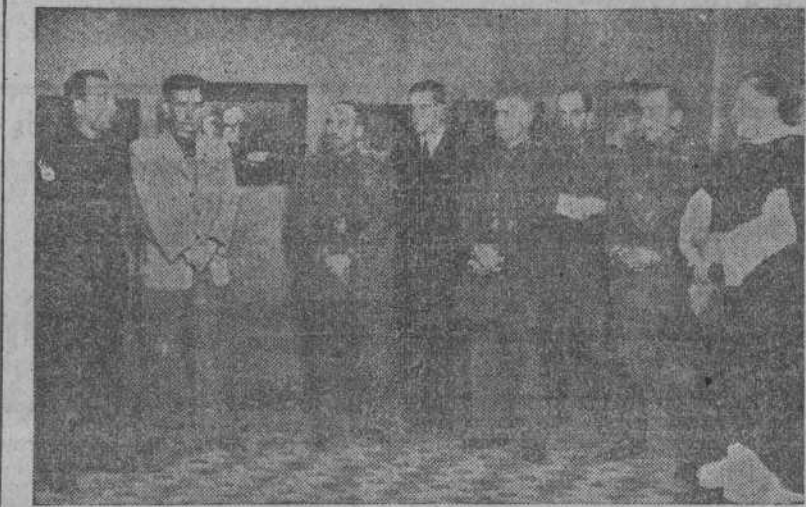
Autoridades y jerarquías en el acto de inaugurar la V Exposición de Arte del S. E. U., instalada en la Asociación de Artistas

El diestro fué trasladado a un sanatorio.—(CIFRA).