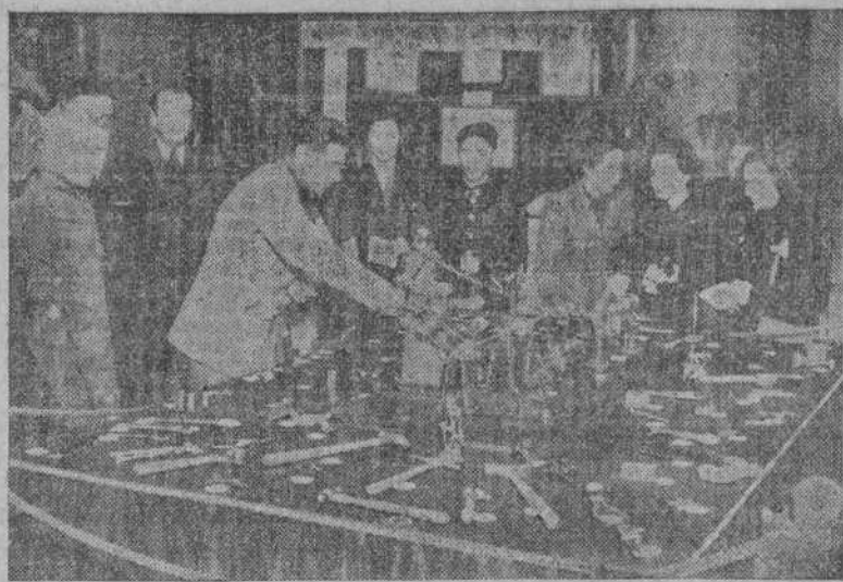
Un aspecto de la Exposición de Trabajos de Aprendices, en la planta baja del Palacio Municipal

Están instaladas en la Asociación de Artistas y en la planta baja del Ayuntamiento