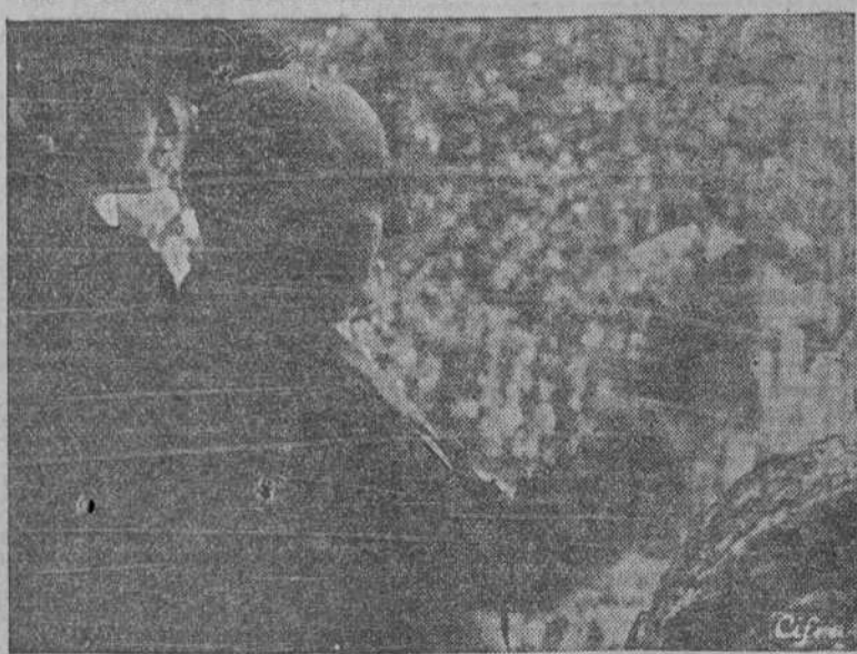
S. E. el Jefe del Estado saluda a la muchedumbre que lo aclamó a su llegada para presidir la corrida de la Beneficencia, celebrada en la Plaza madrileña.

lejos sus reclamaciones con un deseo de represalia".—(EFE).