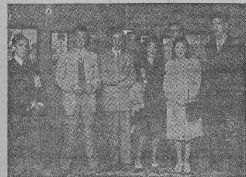
Expositores que obtuvieron premio en la Exposición de Arte del S. E. U.

TELEFONOS DE EL IDEAL GALLEGO ADMINISTRACION 1542 REDACCION 1177 y 1594