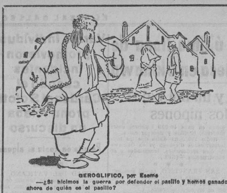
GEROGLIFICO, por Esomé —¿Si hicimos la guerra por defender el pasillo y hemos ganado, ahora de quién es el pasillo?

En verdad; terrible precio para la conquista de una isla de poco más de setecientos cincuenta kilómetros cuadrados.