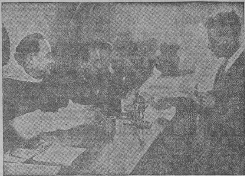
Entrega de becas y títulos a los alumnos de la Escuela Elemental del Trabajo.

Terminaron sus estudios diecinueve alumnos de Mecánica y Electricidad