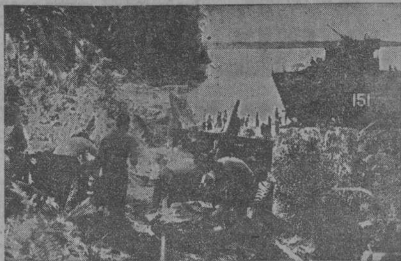
Tropas desembarcadas en la isla de Sadan, australiana, dirigen su fuego contra Tarakan (al fondo) para apoyar los desembarcos de los soldados australianos en dicha isla.