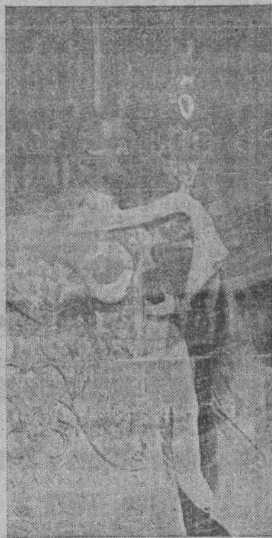
El Dr. Blanco Nájera, Obispo de Orense, da la bendición con el Santísimo a la multitud de fieles estacionada ante la fachada del Obradoiro

Desde mucho antes de la hora fijada, once de la mañana, se empezó a notar en la ciudad la presencia de muchos forasteros, principalmente de los puntos cercanos que habían hecho el trayecto a pie y a medida que la hora se acercaba fué creciendo en intensidad el número de miembros del Apostolado de la Oración que se iban congregando en el Paseo de la Alameda, al pie de las pancartas que se