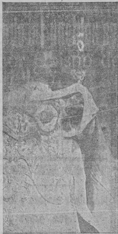
El Dr. Blanco Nájera, Obispo de Orense, da la bendición con el Santísimo a la multitud de fieles estacionada ante la fachada del Obradoiro

No se sabe si los rusos han evacuado a alemanes a Rusia, ya que los corresponsales no han tenido oportunidad de hablar con los prisioneros germanos. Se asegura que Francia tendrá una zona en la capital, pero de momento no ha sido anunciado cuál será la que se designa a este país.