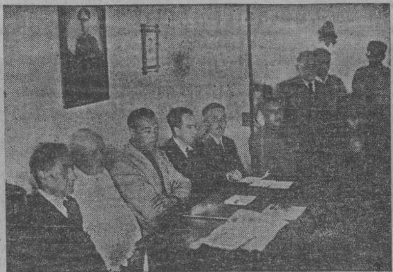
Presidencia del acto de la entrega de donativos a familias de las víctimas habidas en el naufragio del "Cartagena núm. 3"

SANTA EUGENIA DE RIVEIRA.—El día 30 de junio último, y a la hora de once de la mañana, tuvo lugar en el local de la Cofradía de Pescadores de Carreira, la entrega a los familiares de las víctimas del naufragio del motor de pesca "Cartagena III", de las indemnizaciones de carácter graciable concedidas por la Mutualidad de Accidentes del Mar y Trabajo, afecta al Instituto Social de la Marina, como así bien otra importante suma de la referida Cofradía, obtenida con los donativos voluntarios de patronos y marineros, simbolizando este gesto la santa hermandad que une a los productores del mar.