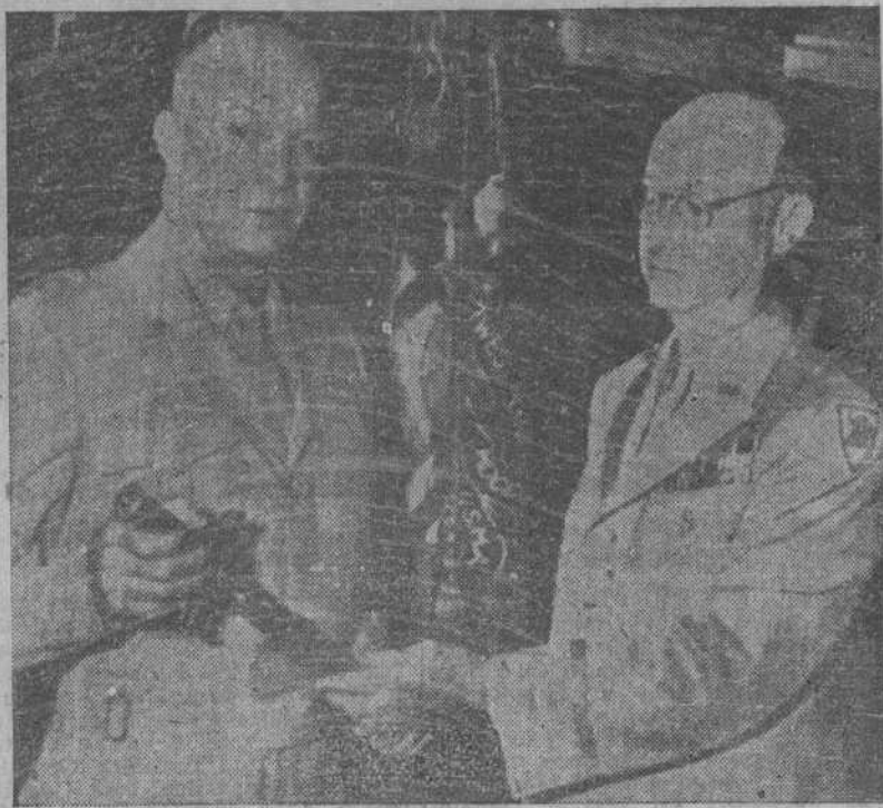
Durante su visita a la Academia Militar norteamericana de West Point, el general Eisenhower (izquierda) entrega al director de la Academia la espada de Napoleón que le fué entregada en París por el general De Gaulle. (Foto recibida por radio)