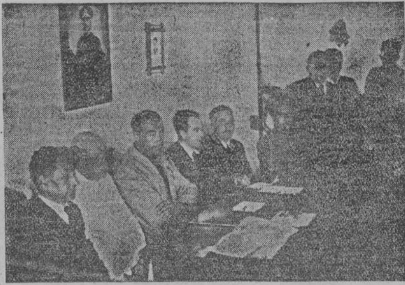
Presidencia del acto de la entrega de donativos a familias de las víctimas habidas en el naufragio del "Cartagena núm. 3"

SANTA EUGENIA DE RIVEIRA.—El día 30 de junio último, y a la hora de once de la mañana, tuvo lugar en el local de la Cofradía de Pescadores de Carreira, la entrega a los familiares de las víctimas del naufragio del motor de pesca "Cartagena III", de las indemnizaciones de carácter graciable concedidas por la Mutualidad de Accidentes del Mar y Trabajo, afecta al Instituto Social de la Marina, como así bien otra importante suma de la referida Cofradía, obtenida con los donativos voluntarios de patronos y marineros, simbolizando este gesto la santa hermandad que une a los productores del mar.