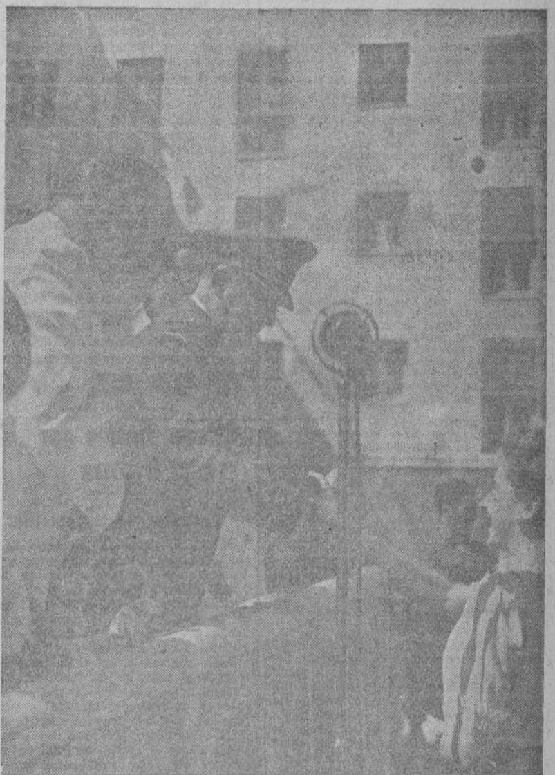
S. E. el jefe del Estado entrega las llaves de una de las viviendas del grupo "Virgen del Carmen", inaugurado en Madrid el 18 de julio.