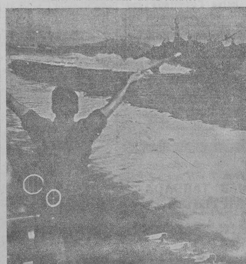
Un señalero sobre una lancha torpedera norteamericana transmite un mensaje a otra embarcación, mientras marchan en patrulla por el Pacífico