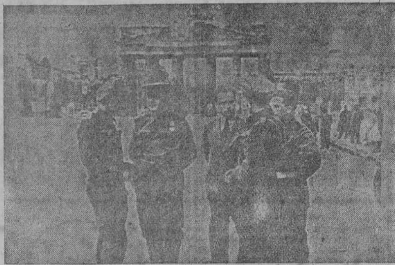
Soldados Británicos conversando con un soldado ruso y un intérprete en el mismo centro de Berlín. -- Al fondo, la puerta de Brandenburgo y el Unter den Linden