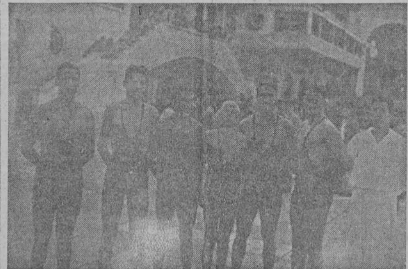
Vencedores en las distintas pruebas de natación celebradas ayer y organizadas por el Club de Natación, para infantiles, cadetes y hombres.

Hoy, a las seis de la tarde, tendrá lugar la segunda y última jornada de estos campeonatos.