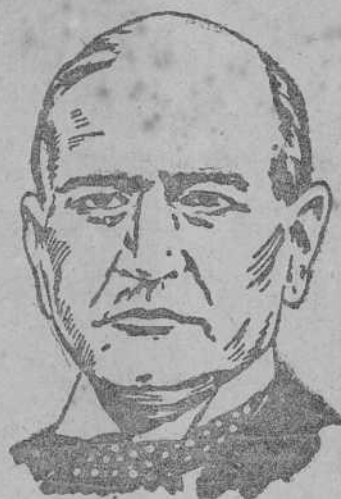
Daladier no logró hacer eficaz el Instrumento de guerra francés. Dos meses y medio después de la guerra, puntos vitales para la defensa del país seguían poco menos que desmantelados.

CAPITULO V Una prueba de la ligereza con que se trataba el problema militar en Francia, incluso en plena guerra, es el deseo que se apuntaba en el Parlamento de intervenir en el conflicto entre Finlandia y los soviets, como si no viviésemos bastante con el coloso alemán y pudiésemos permitirnos el lujo de añadir el peligro del coloso ruso.