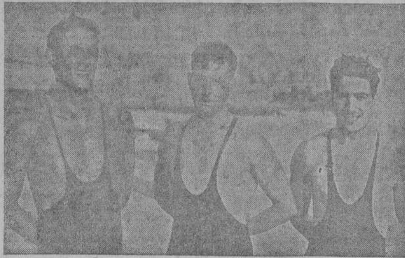
Equipo de relevos 3 por 100 del Club de Natación, vencedor en el campeonato local celebrado ayer.

Hoy, a las seis, segunda y última sesión