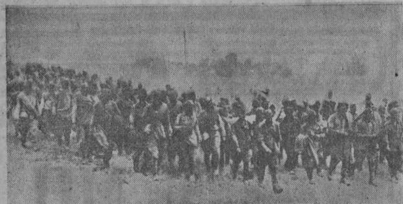
"Goering nos dijo también que era tal el hambre que padecían los prisioneros rusos que para llevarlos hasta los campos de concentración no era necesario conducirlos con centinelas, sino simplemente con una cocina de campaña a la cabeza de la columna". - En la fotografía millares de prisioneros soviéticos camino de los campos de concentración

En otro orden de cosas, un día antes de entrar en guerra con los Estados Unidos, el Gobierno italiano estudiaba la necesidad de pedir a Alemania un préstamo de medio millón de toneladas de trigo.