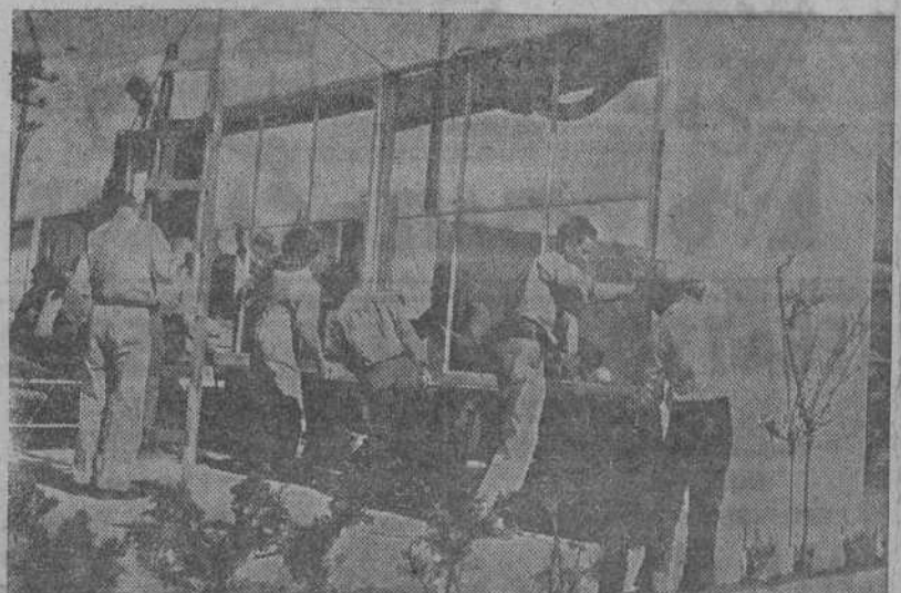
Para combatir la falta de viviendas, los norteamericanos han comenzado a construir en serie, como las estilográficas o los automóviles. En la foto vemos a los obreros colocando la sección de una ventana completa, con persianas y cortinas. Los jardineros han plantado ya los arbustos en primer término.

TELEFONOS DE EL IDEAL GALLEGO ADMINISTRACION 1549 REDACCION 1177 y 1284