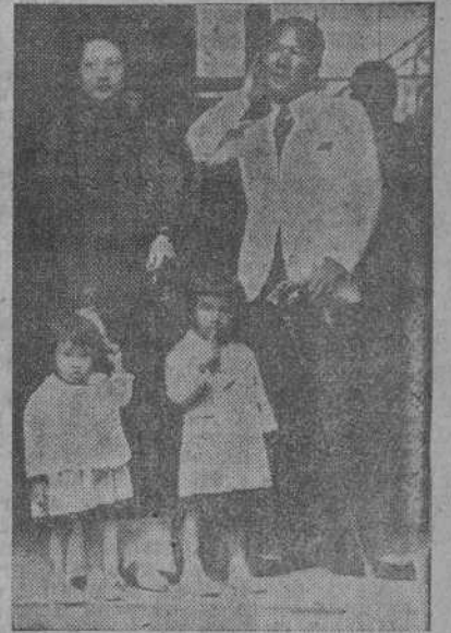
En la fotografía, el Emperador con la Emperatriz y sus hijos.

BAO DAY, EL EMPERADOR DEL ANNAM, QUE HA ABDICADO