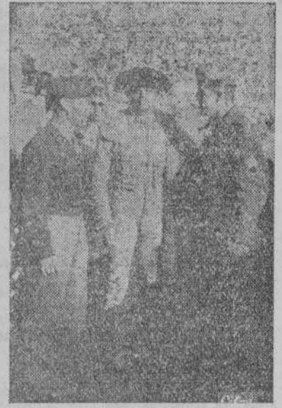
San Sebastián.—Dos soldados universitarios norteamericanos charlan con Armillita, el torero mejicano, durante una de las corridas de toros celebradas recientemente en aquella plaza. También a los yanquis les entusiasma la fiesta nacional española.