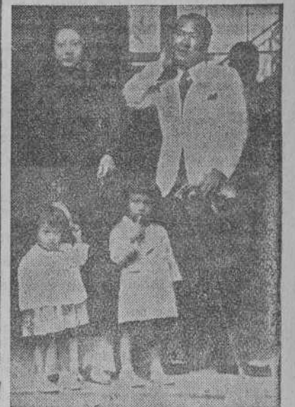
En la fotografía, el Emperador con la Emperatriz y sus hijos.

BAO DAY, EL EMPERADOR DEL ANNAM, QUE HA ABDICADO