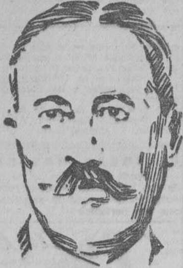
GIRAUD Hecho prisionero por los alemanes el 16 de mayo de 1940 (Dibujo de Orbeagozo).

¿Hasta qué punto influyó en el resultado de la guerra la moral vacilante de nuestro ejército y por consiguiente la de nuestra nación, puesto que muchos soldados de aquellas unidades eran reservistas? La campaña de murmuraciones encaminada a debilitar la posición de Francia llegó en algunos sectores a que se proclamara abiertamente: "Mejor Hitler que Stalin" y en otros a que se formulase esta pregunta: ¿Por qué hemos de morir por Dantzig? Todo ello, ciertamente, tuvo que afectar a la moral