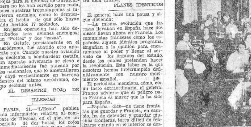
En los talleres establecidos por "Mujeres al servicio de España" en los altos del Monte de Piedad (Foto Canelo).

en la guerra que España está librando contra las hordas del marxismo no ha surgido—por lo menos hasta ahora—una figura de heroína al modo de Agustina de Aragón o de nuestra María Pita. Mas no falta, sino que, por el contrario, en todas partes florece ese otro heroísmo manso y callado de la mujer que trabaja, que sufre y que reza, mientras el soldado español lucha y muere en los campos de batalla. Todos están en su puesto: él, empujando las armas; ella, cuidando de que nada le falte al que pone su vida para servir a España. La mujer coruñesa está dando una lección magnífica. "Mujeres al servicio de España" es el nombre