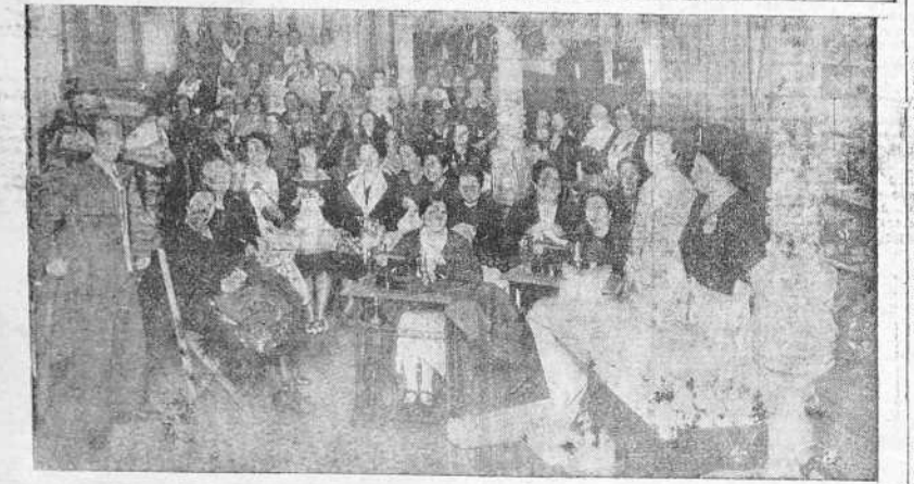
Un aspecto de los talleres, en pleno trabajo, establecidos en la calle de San Nicolás por la agrupación "Mujeres al servicio de España" y donde un grupo de patrióticas mujeres confeccionan incansablemente prendas de abrigo para las fuerzas nacionales.

Esta tarde, a las siete y media, se celebrará la apertura de la Tumbola que el Negociado noveno del Gobierno Civil ha instalado en el bajo que ocupó el periódico EL IDEAL GALLEGO, en el Cantón Grande. La entrada es gratis. El sitio es céntrico. El fin es excelente. Los objetos son espléndidos. Habrá alguna persona que, al pasar por el Cantón Grande, deje de gastar unos céntimos en unas rifas?