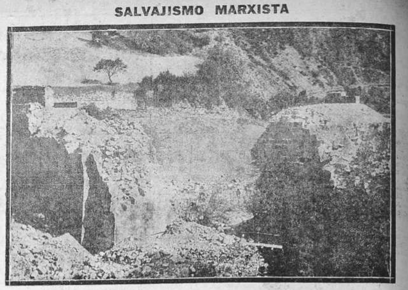
He aquí el estado en que quedó uno de los puentes volados por los rojos para intentar impedir el avance victoriosamente arrollador de las fuerzas de España camino de Oviedo.

PARIS 21.— Ha causado gran impresión los graves acontecimientos registrados en Chartres, en los que hubo choques sangrientos entre los obreros de las fábricas azucareras y los campesinos de la región. El periódico "Action Française", al comentar los sucesos, dice que la policía a las órdenes del ministro Salengro, no ha detenido todavía,