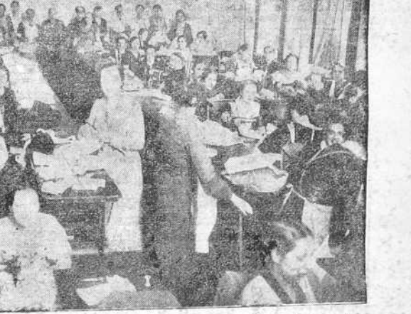
En los talleres establecidos por "Mujeres al servicio de España" en los altos del Monte de Piedad.

en la guerra que España está librando contra las hordas del marxismo no ha surgido—por lo menos hasta ahora—una figura de heroína al modo de Agustina de Aragón o de nuestra María Pita. Mas no falta, sino que, por el contrario, en todas partes florece ese otro heroísmo manso y callado de la mujer que trabaja, que sufre y que reza, mientras el soldado español lucha y muere en los campos de batalla. Todos están en su puesto: él, empujando las armas; ella, cuidando de que nada le falte al que pone su vida para servir a España. La mujer coruñesa está dando una lección magnífica. "Mujeres al servicio de España" es el nombre