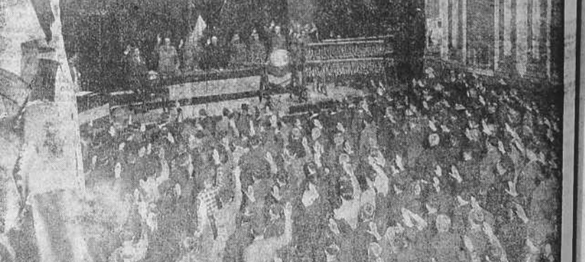
En el teatro Rosalía de Castro se celebró ayer mañana, con asistencia de las autoridades, el sorteo de la Lotería patriótica organizada por la Diputación Provincial. He aquí el momento en que, al dar comienzo el acto, autoridades y público, puesto en pie, escuchan los himnos del Tercio y de Falange. (Foto Blanco).