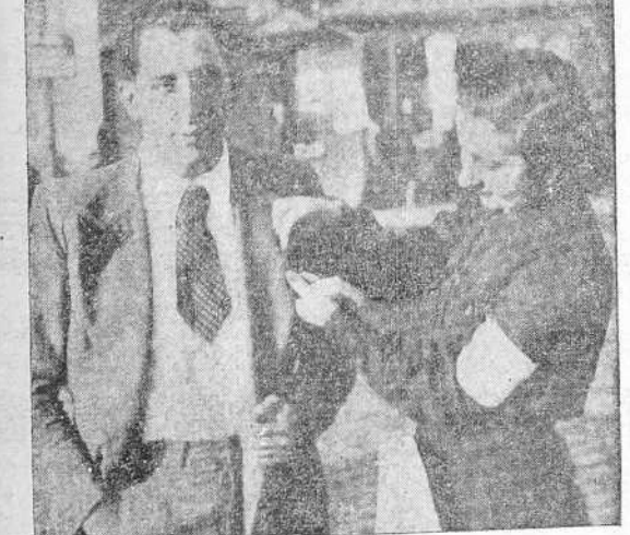
Una señorita de la Sección Femenina de Falange coloca a uno de los donantes el emblema del "Auxilio de Invierno".

La recaudación total rebasó la cifra de seis mil pesetas